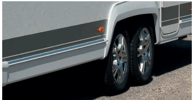
Jantes aluminium assorties