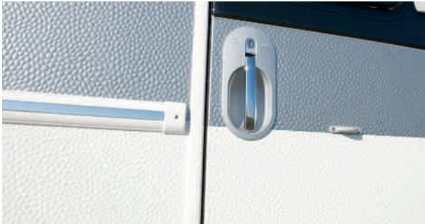
Poignée d'aide à l'entrée optique chrome