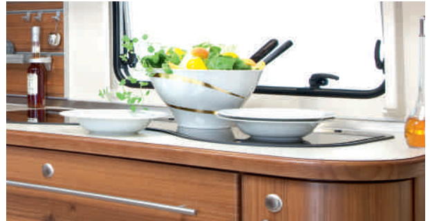
Bloc cuisine avec tiroirs casseroles à freins autoamortissants