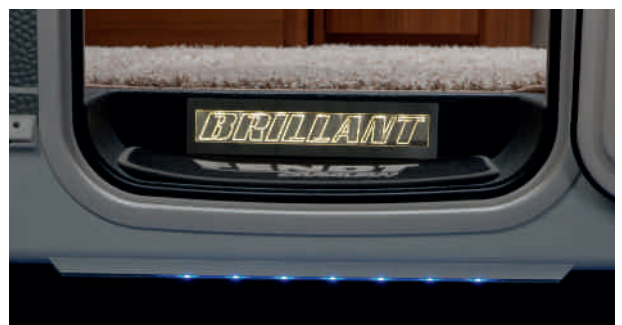
Éclairage LED intégré dans le marchepied pour une entrée sécurisée

Toutes les données, descriptions et illustrations ainsi que les prix, packages de livraison, caractéristiques techniques, constructions, équipements, matériaux et représentations photographiques datant de la mise en impression de ce catalogue ne sont pas contractuelles. Fendt-Caravan se réserve le droit d'y apporter des modifications tant dans la conception, la fabrication que les conditions commerciales, dans la limite des droits du consommateur. Des imperfections d'impression et/ou de restitution de couleurs ne sont pas exclues.