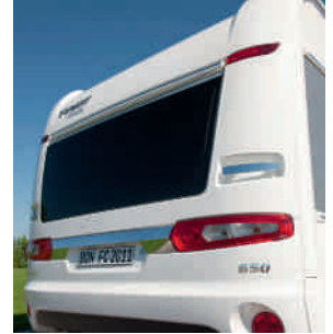
Faces avant et arrière technologie LFI (polyuréthane fibres longues injection) offrant stabilité et résistance