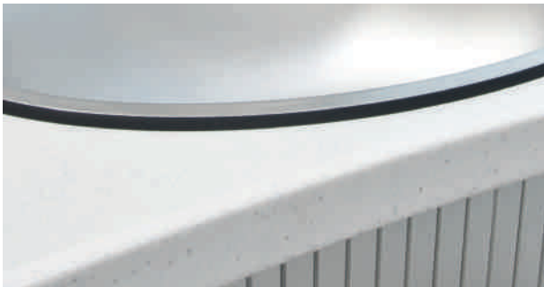
Plan vasque en résine de synthèse