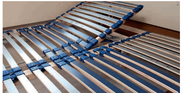
Sommiers à tête réglable et lattes articulées avec ponts d'articulation élastiques avec réglage de fermeté