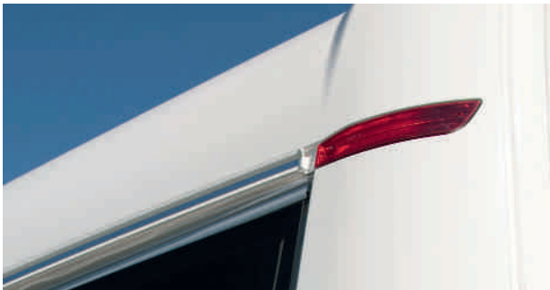
Combiné LED feux de gabarit et feux stop, sécurité oblige