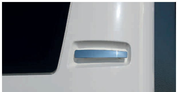
Poignées de manœuvre arrière gauche et droite, design exclusif et finition chromée

Une caravane Fendt est reconnaissable au premier regard. La ligne extérieure est nette et parfaite, pensée et réalisée dans le pur esprit Fendt-Caravan. L'évolution dynamique aux contours soignés reflète l'interprétation toute personnelle des lignes classiques. Au-delà de l'approche visuelle, l'aspect pratique, la longévité et la facilité de réparation en cas d'accident ont été particulièrement étudiés. La présentation ci-dessus permet, d'un simple coup d'œil, de visualiser nombres de détails extérieurs qui parlent sans aucun doute en faveur de Fendt-Caravan.