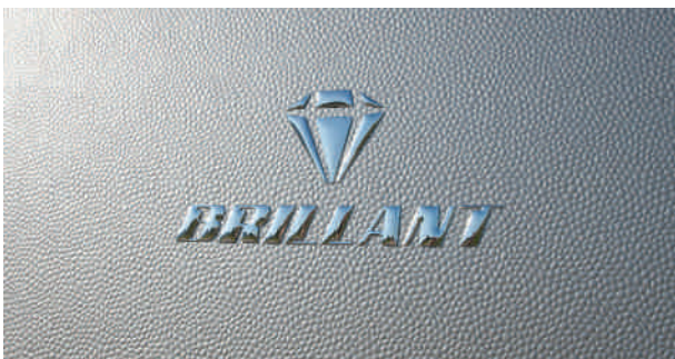
Brillant tout simplement