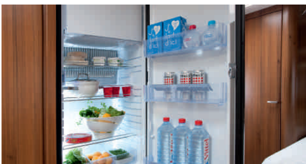
Réfrigérateur Slim Tower 140 litres avec façade miroir (allumage piezzo électrique, congélateur amovible avec éclairage)