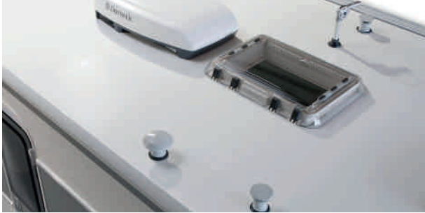
Pavillon en fibre de verre renforcée anti-grêle