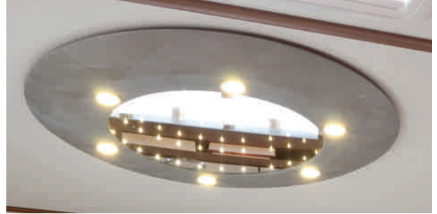
Plafonnier module 3D