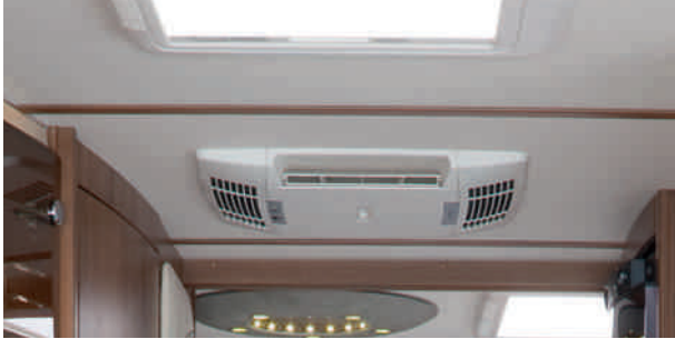
Climatiseur avec télécommande de série