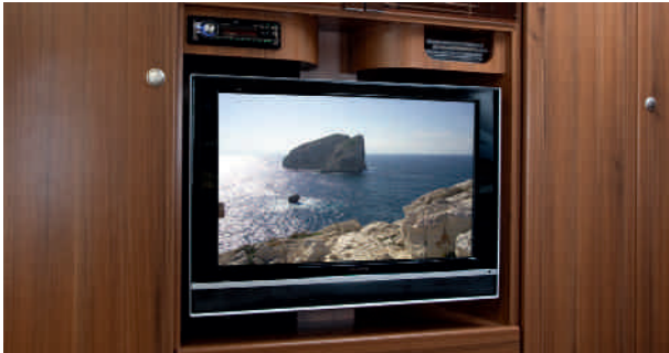
Mediathèque pour radio, TV écran plat 26", démodulateur et lecteur DVD