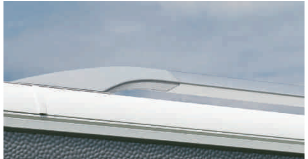
Barres de toit pour un fini irréprochable